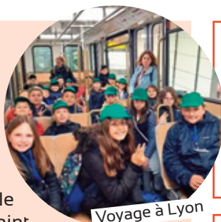
Voyage à Lyon

D'Halloween à la kermesse , en passant par le repas de Noël , le carnaval et le cross de la Saint-Nicolas, chaque événement a apporté son lot de rires, de déguisements colorés et de souvenirs impérissables. Les élèves de CM2 ont eu la chance de se rendre à Lyon en train et de découvrir en autres les traboules du vieux Lyon lors d'un voyage de fin d'année inoubliable - une expérience qui restera gravée dans les mémoires. Ces moments festifs ne sont pas que des parenthèses : ils forgent l'esprit d'équipe, la curiosité et la joie de vivre des enfants.