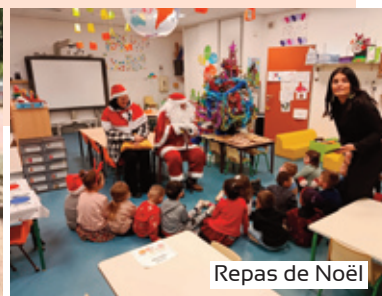
Repas de Noël