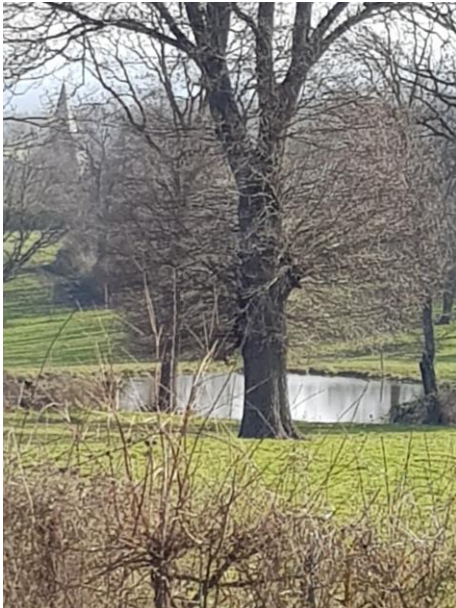
La font riant

✓ Nous lançons une récolte de documents, photos, témoignages sur le thème de l'EAU dans la commune, ( sources, fonts, rus, ruisseaux, Meuzelle, moulins, lavoirs, puits, eau potable ).