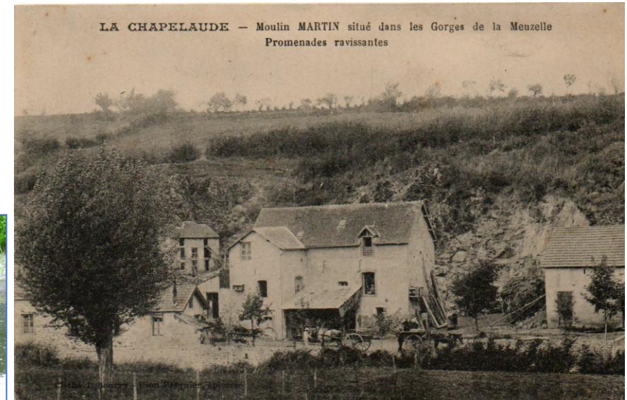
Un des moulins de La Chapelaude