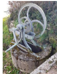
Le puit en face du cimetière